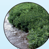
Myrique baumier Myrica gale